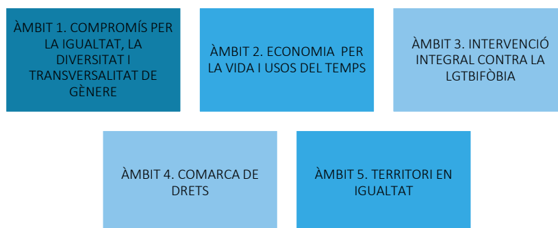
GRÀFICA 1. ÀMBITS O EIXOS ESTRATÈGICS DE TREBALL PREVISTOS EN EL PLA COMARCAL LGTBI+ DEL TARRAGONÈS (2023-2027)

Fruit d'aquest treball de diagnosi previ, s'han elaborat el Pla comarcal LGTBI+ del Tarragonès (2023-2027) , on s'estableixen les línies d'actuació que hauran de guiar l'acció del CCT durant els pròxims quatre anys quant a polítiques de gènere a la comarca, articulades d'acord amb els àmbits d'actuació de referència següents: